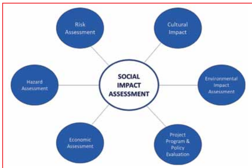
Figura 1 - Social Impact Assessment.

modo che i progetti soddisfino le loro esigenze; - lo sviluppo della comunità: il progetto dovrebbe contribuire a creare opportunità per i membri; - la diversità e l'inclusione: garantire che tutti abbiano pari accesso ai benefici del progetto, indipendentemente dalla loro etnia, genere o status socioeconomico; - il monitoraggio e la valutazione: identificare le aree in cui il progetto potrebbe fallire e che necessitano di correzioni per garantire la sostenibilità. In generale, la valutazione di impatto sociale (Social Impact Assessment) riguarda il valore sociale aggiunto generato, i cambiamenti sociali prodotti e la sostenibilità dell'azione sociale, e si basa sui principi di intenzionalità, rilevanza, affidabilità, misurabilità, comparabilità, trasparenza e comunicazione. La sostenibilità ambientale può essere definita come la responsabilità di conservare le risorse naturali e proteggere gli ecosistemi globali, sostenendo la salute e il benessere nel tempo, il tutto con uno sguardo orientato al futuro: ad esempio, la U.S. Environmental Protection Agency definisce la sostenibilità ambien-